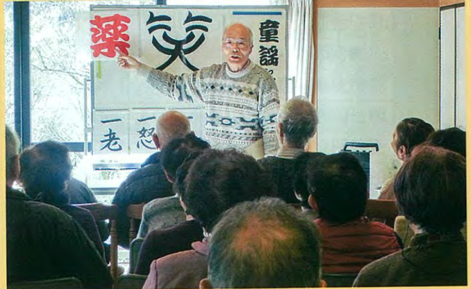
『笑いヨガ』（左段） <過去の【居場所づくり】開催の様子> 『童話と楽しいお話』（右段）