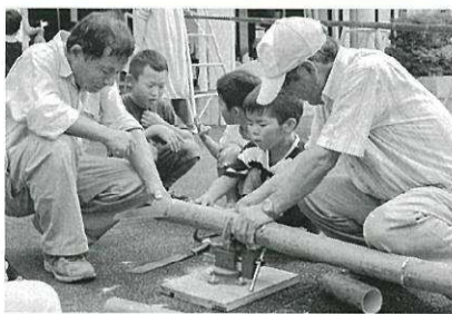
世代間交流の様子