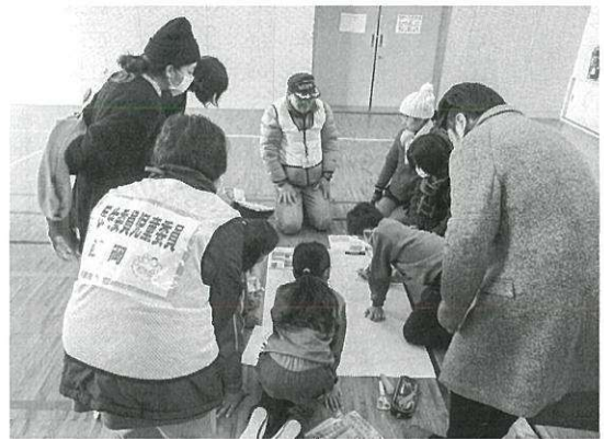
外城田小学校防災教育への協力