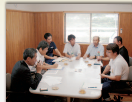
協定先との価格交渉及び情報交換を行う