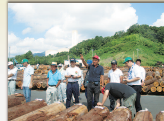
原木市場にて／価格の情報収集