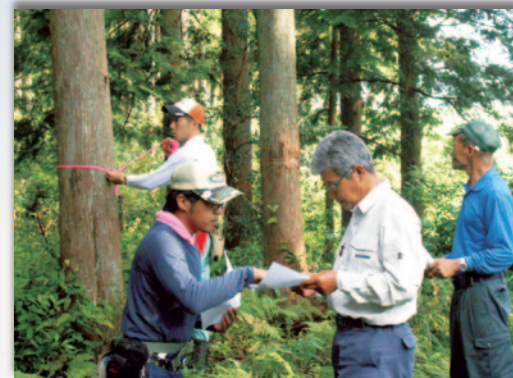
境界確定のための現場立会い