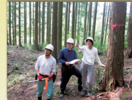
立木買取の依頼現地にて／森林所有者の立会い