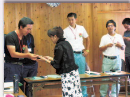
社会人としての基本を学ぶマナー講習の実施