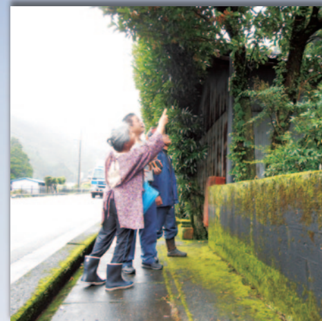
人家周りの支障木処理の立会い