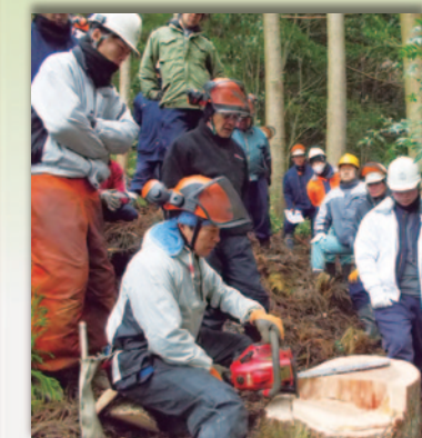
OJT(現場内)研修での伐木指導