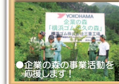
●企業の森の事業活動を応援します！