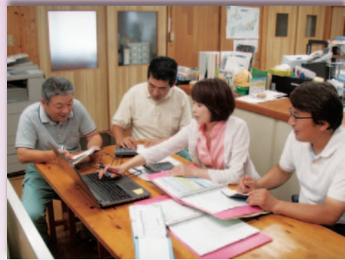
低コスト・効率化に向けてのミーティング