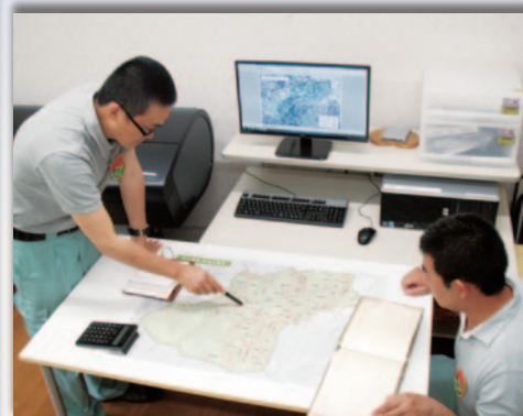
森林GISを活用した境界明確化作業