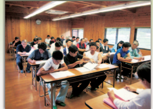
毎月の安全会議～ヒヤリハット報告、情報の提供