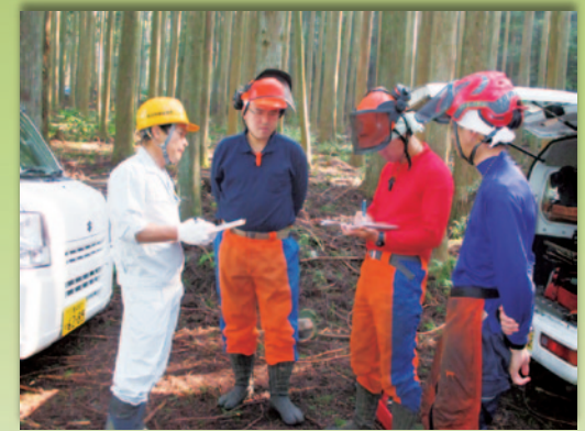
現場を廻っての直接指導