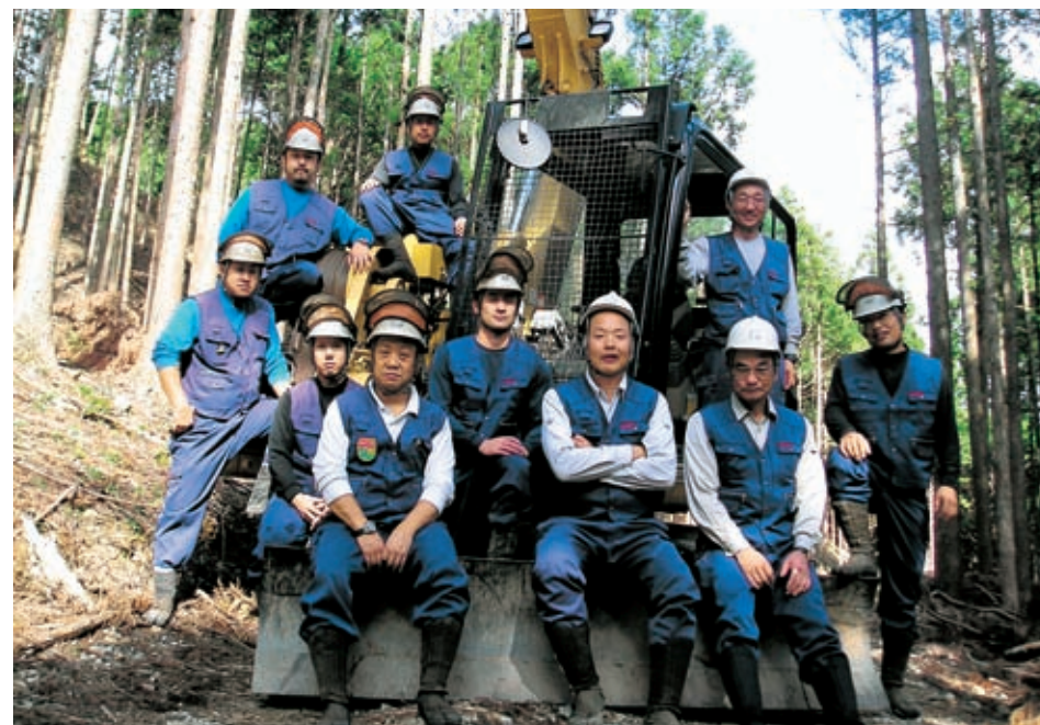
スイングマーダによる列状間伐現場(七廻り)にて