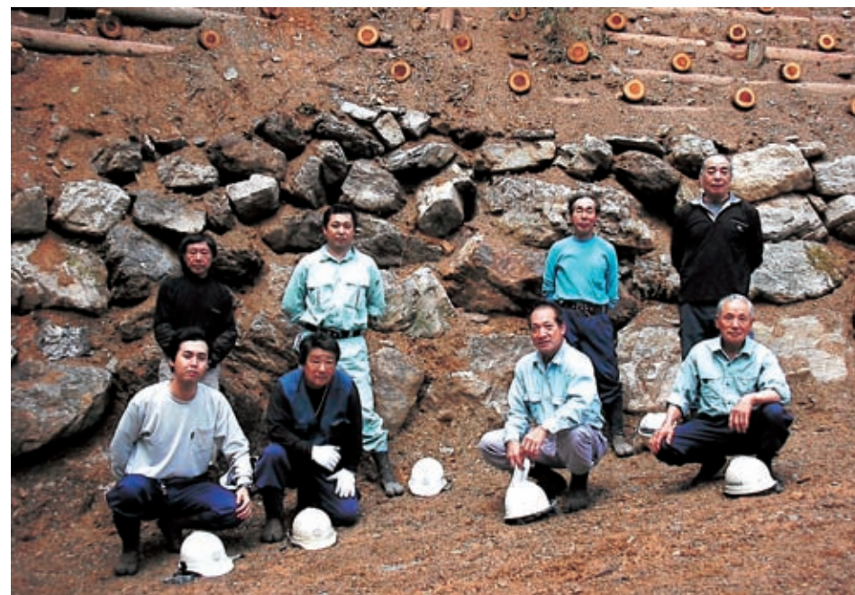
岩内山作業道開設現場にて