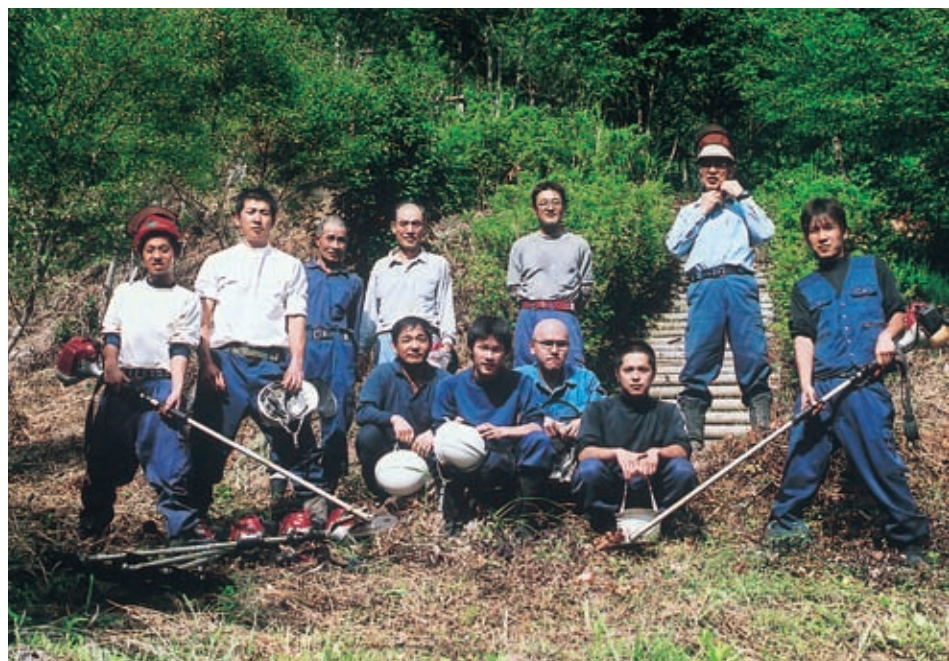
大内山大平下刈現場にて一息

日々の経理・管理・購買業務等に加え様々な庶務全般を担っています。職員・現業職員ひとりひとりに対する理解とバランス感覚を重視し、「縁の下の力持ち」としての役割を果たせるよう、二人で職務に励んでいます。購買では、林業に関する様々な道具等を取扱っていますので、気軽にお立ち寄り下さい。