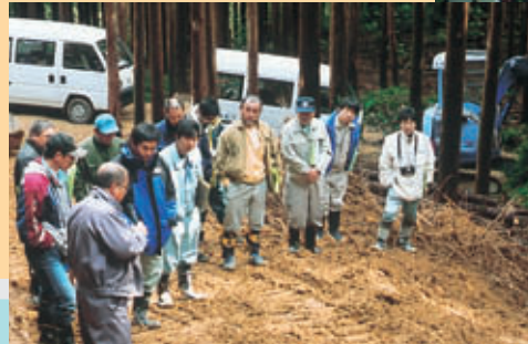
緑資源公団による「壊れない道づくり」の現地研修会（大宮町野原公園地内にて）

ここにその一端を紹介し、少しでも皆様方に道づくりに対する認識を深めて頂くことで、今後の事業活動に繋げていければと考えておりますのでどうかこれからもご支援の程宜しくお願い致します。