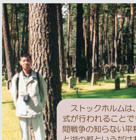
世界遺産でもある森林墓地は一面芝生に覆われ樹齢200年の赤松の中に存在する。

最後に、林業事情が低迷しているこのような時節にもかかわらず、北欧を視察する機会をいただいたことを心より感謝いたします。今後は、この研修での体験と知識を少しでも活かし、組合業務、森林経営の普及に取組んでいきます。ありがとうございました。