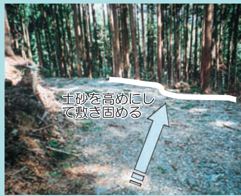
土砂を高めにして敷き固める