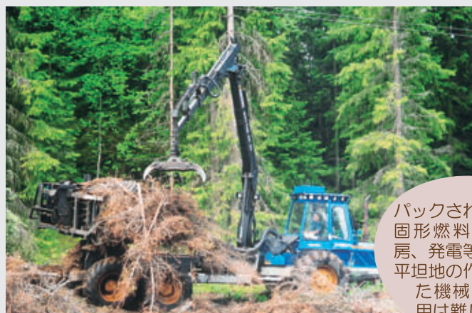
バックされた枝葉は固形燃料化され暖房、発電等に利用される。平坦地の作業用に開発された機械で、日本での活用は難しいだろう。