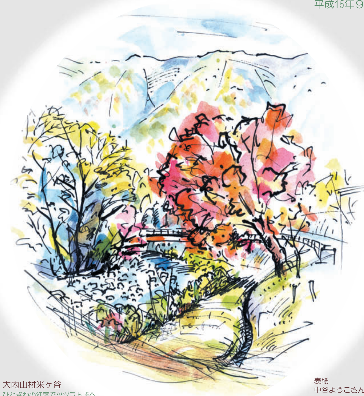
大内山村米ヶ谷 ひときわの紅葉でツツラト峠へのハイカーを迎えるもみじ