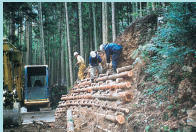
丸太組による切取土留工 施工重機は0.25m以下の小型を使用