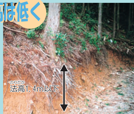
のりだか法高1.4m以下