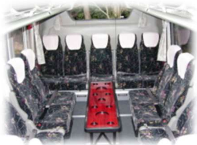
2列回転サロンシート