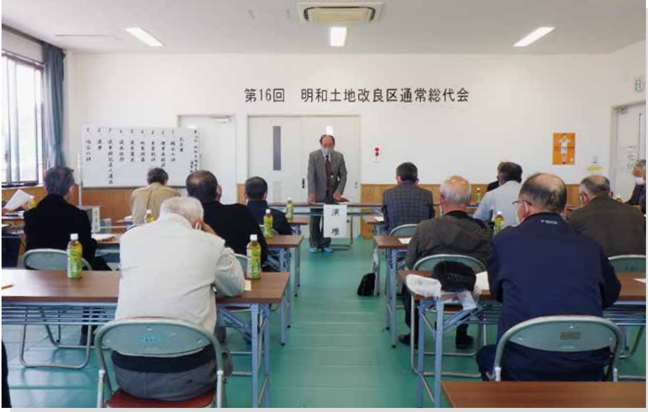
写真：第16回 通常総代会（明和町担い手センター）