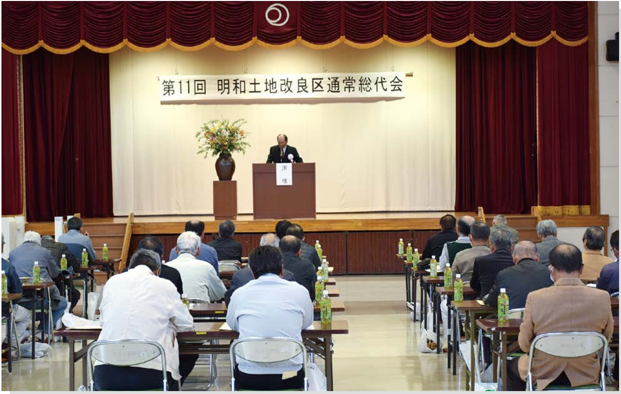
写真：第11回通常総代会（明和町中央公民館）