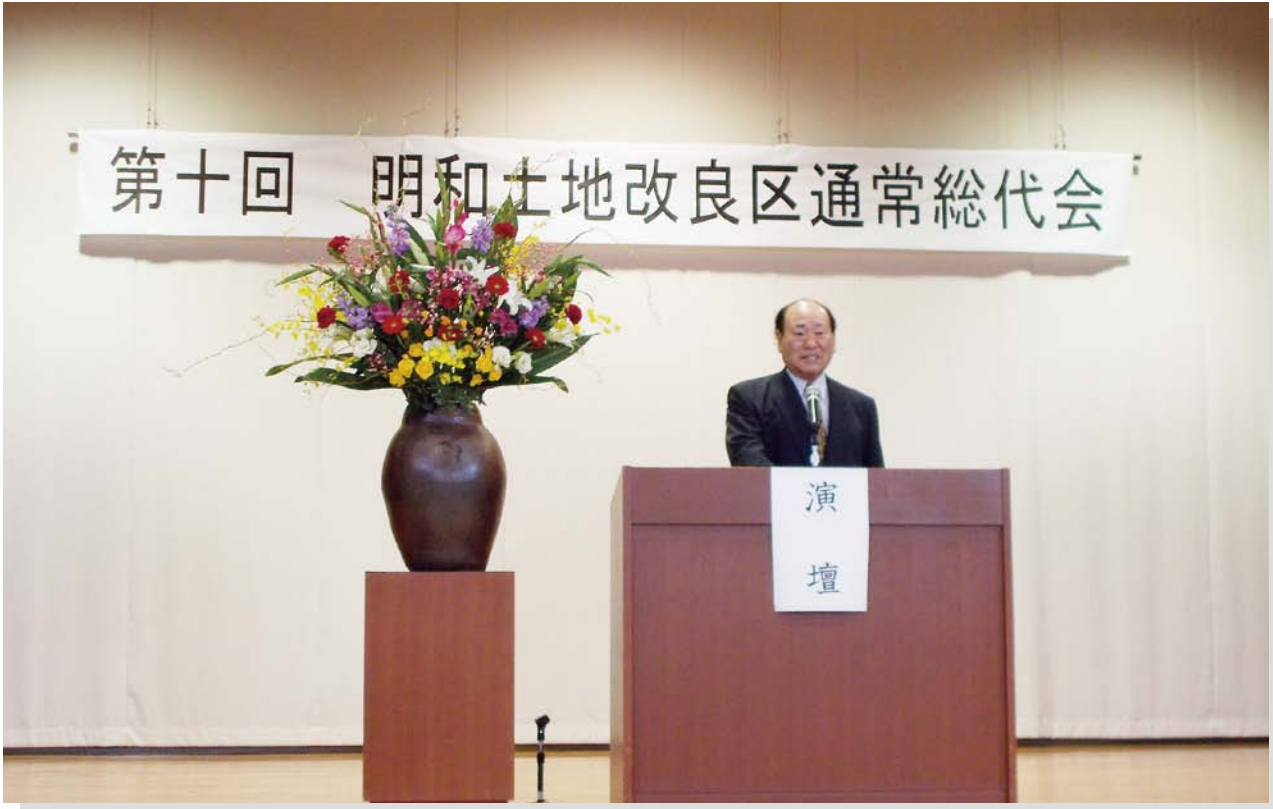
写真：第10回通常総代会（明和町中央公民館）