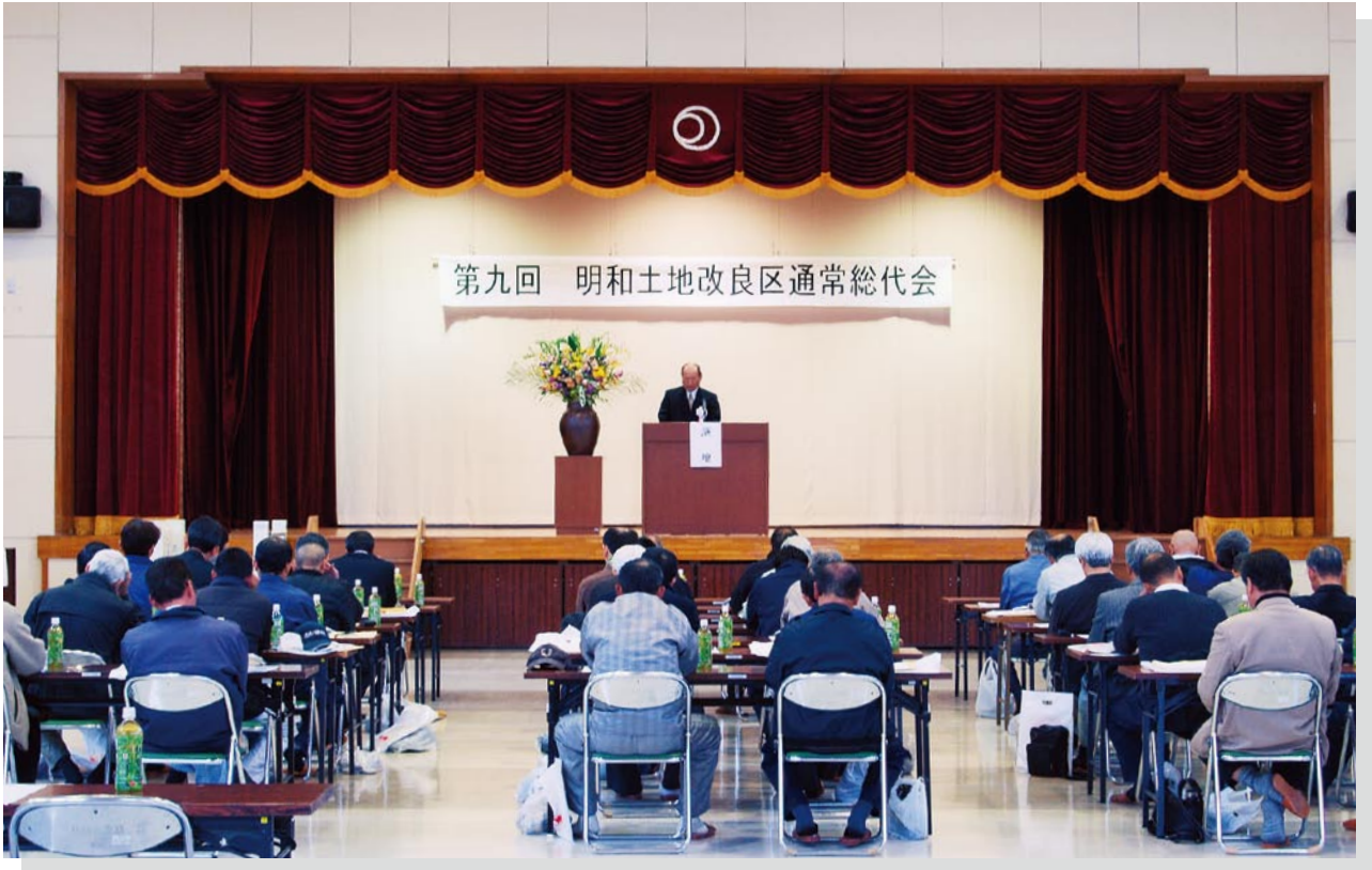
写真：第9回通常総代会（明和町中央公民館）