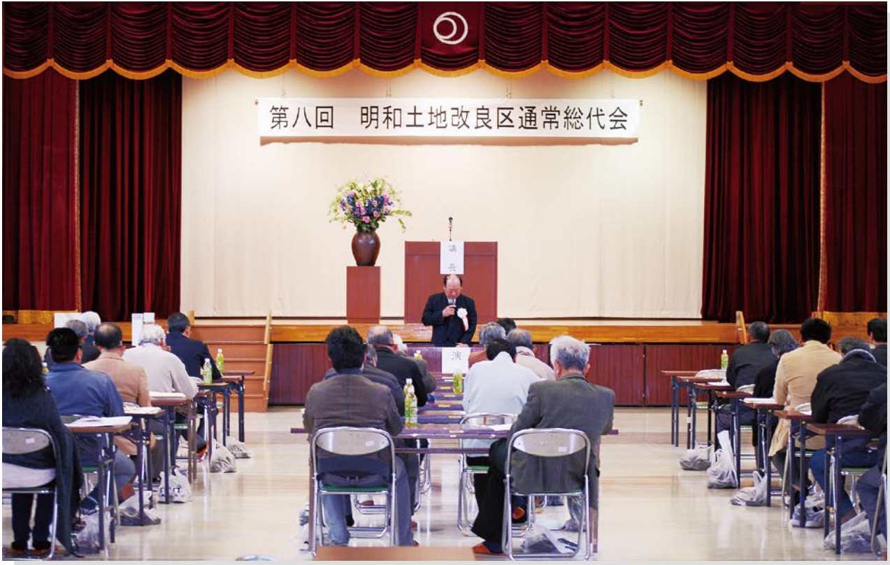
写真：第8回通常総代会（明和町中央公民館）