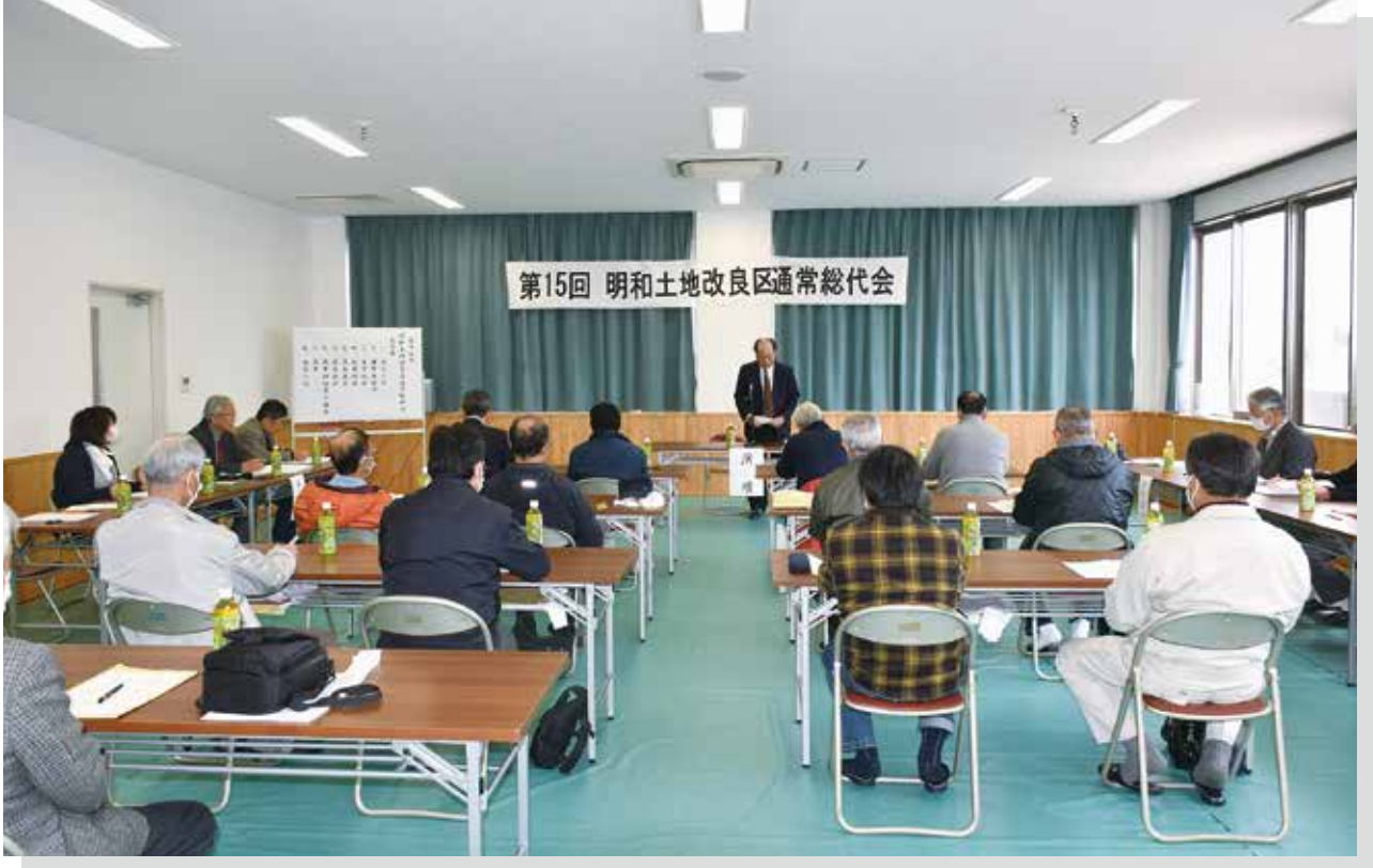
写真：第15回 通常総代会（明和町担い手センター）