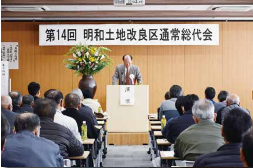
写真：第14回通常総代会 (多気郡農業協同組合本店)