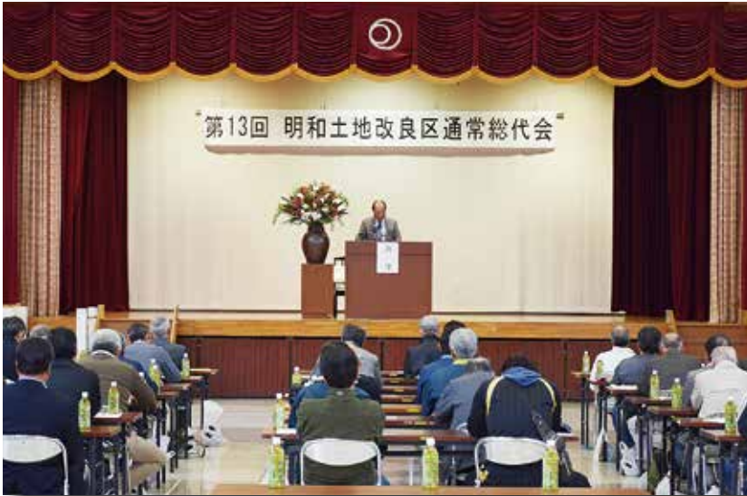
写真：第13回通常総代会 (明和町中央公民館)