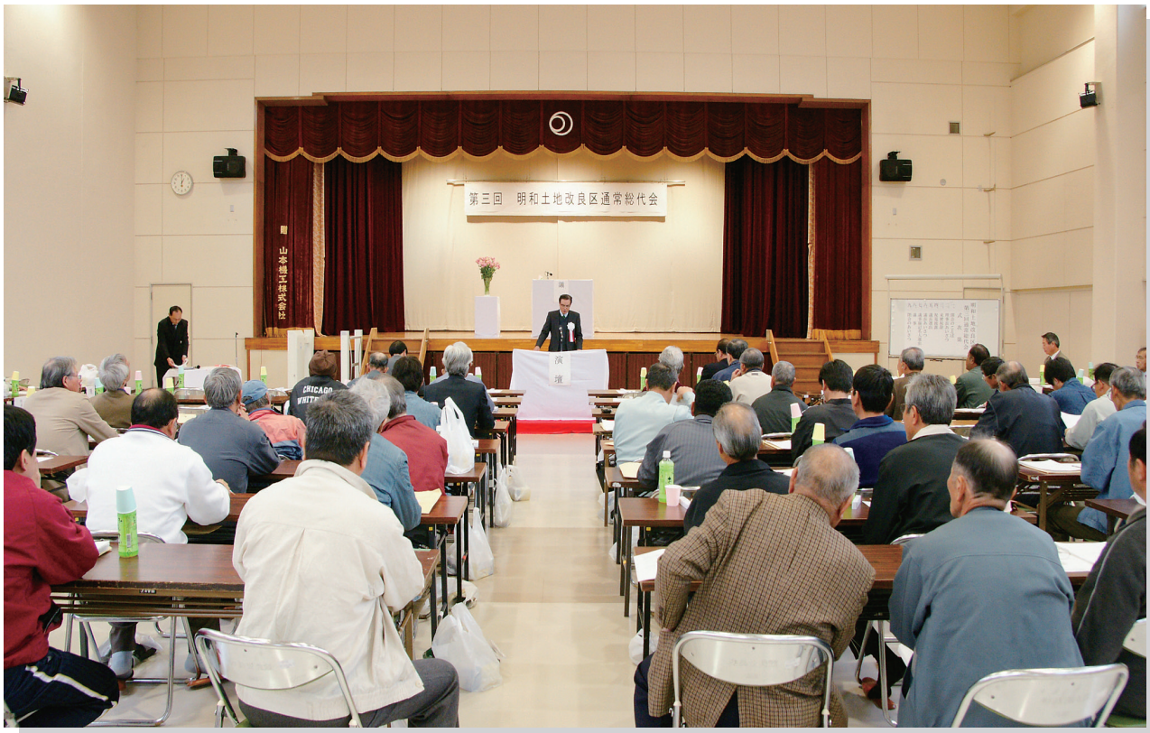
写真：第3回通常総代会