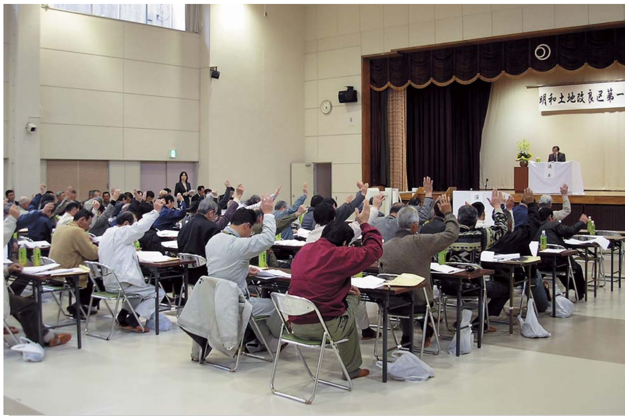
(写真：第1回通常総代会)